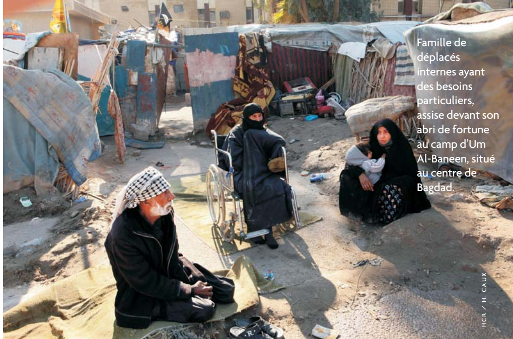
Famille de déplacés internes ayant des besoins particuliers, assise devant son abri de fortune au camp d'Um Al-Baneen, situé au centre de Bagdad.