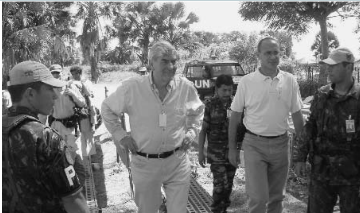
Le Haut Commissaire s'est rendu au Timor oriental en mai 2002.

L'Appel global 2003 offre une vue d'ensemble des opérations et des besoins financiers du HCR pour l'année à venir, tout en décrivant les objectifs, les priorités et les hypothèses de planification de l'Organisation.