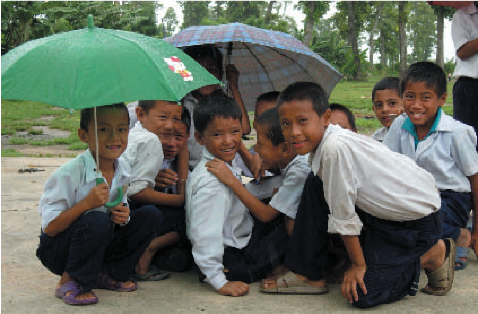
Au camp de Khudunabari, de jeunes réfugiés bhoutanais profitent d'une petite accalmie des pluies de mousson.

Tout en respectant le processus bilatéral entamé par les Gouvernements népalais et bhoutanais pour parvenir à un rapatriement, l'UNHCR s'efforcera entre-temps d'obtenir la réinstallation des réfugiés vulnérables dont le retour au pays n'est pas envisageable. Les possibilités d'intégration sur place seront également examinées dans le cadre de l'approche globale.