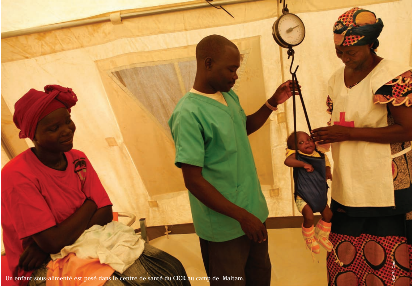
Un enfant sous-alimenté est pesé dans le centre de santé du CICR au camp de Maltam.