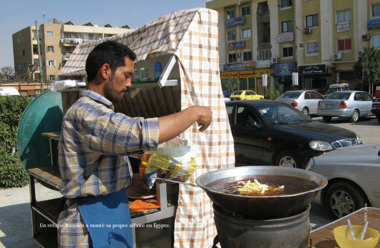
Un réfugié iraquien a monté sa propre affaire en Égypte.