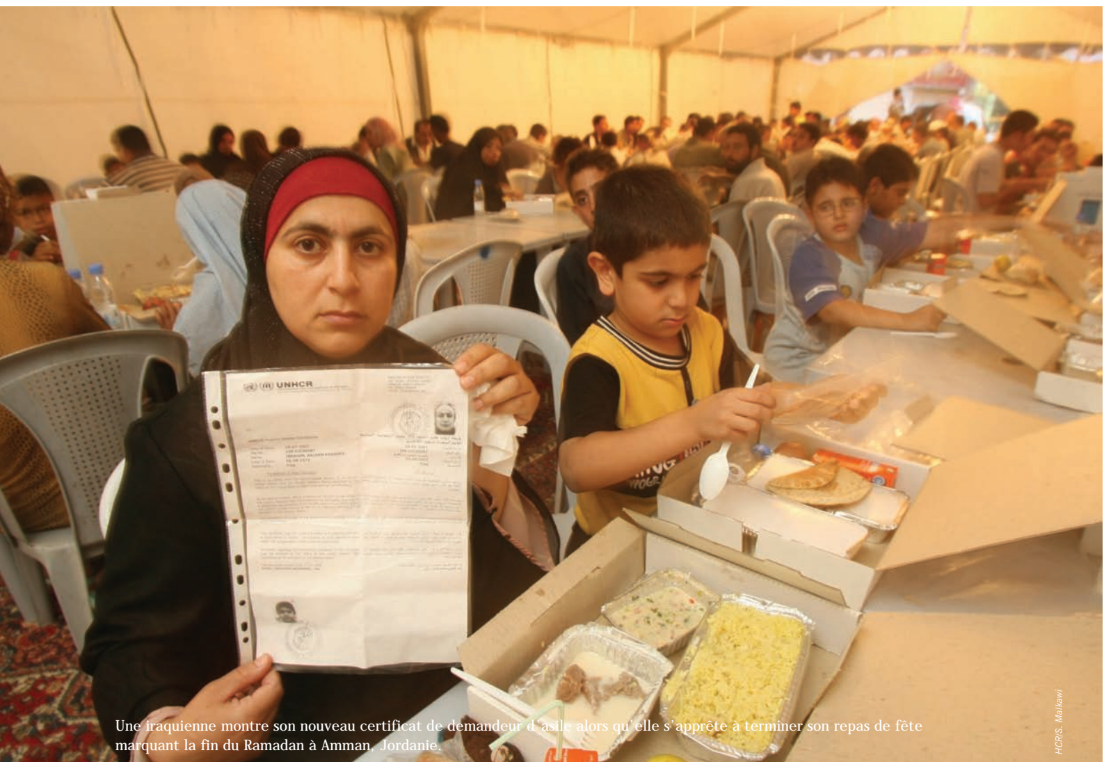
Une iraquienne montre son nouveau certificat de demandeur d'asile alors qu'elle s'apprête à terminer son repas de fête marquant la fin du Ramadan à Amman, Jordanie.

Le HCR vient en aide aux réfugiés palestiniens, notamment à ceux qui sont bloqués dans des zones frontalières situées entre l'Iraq, la Jordanie et la Syrie, en dispensant une assistance vitale, notamment des vivres et des soins médicaux, et cherche dans le même temps à les faire transférer d'urgence dans des lieux plus sûrs. En 2008, le Gouvernement soudanais a signé une déclaration dans laquelle il acceptait le