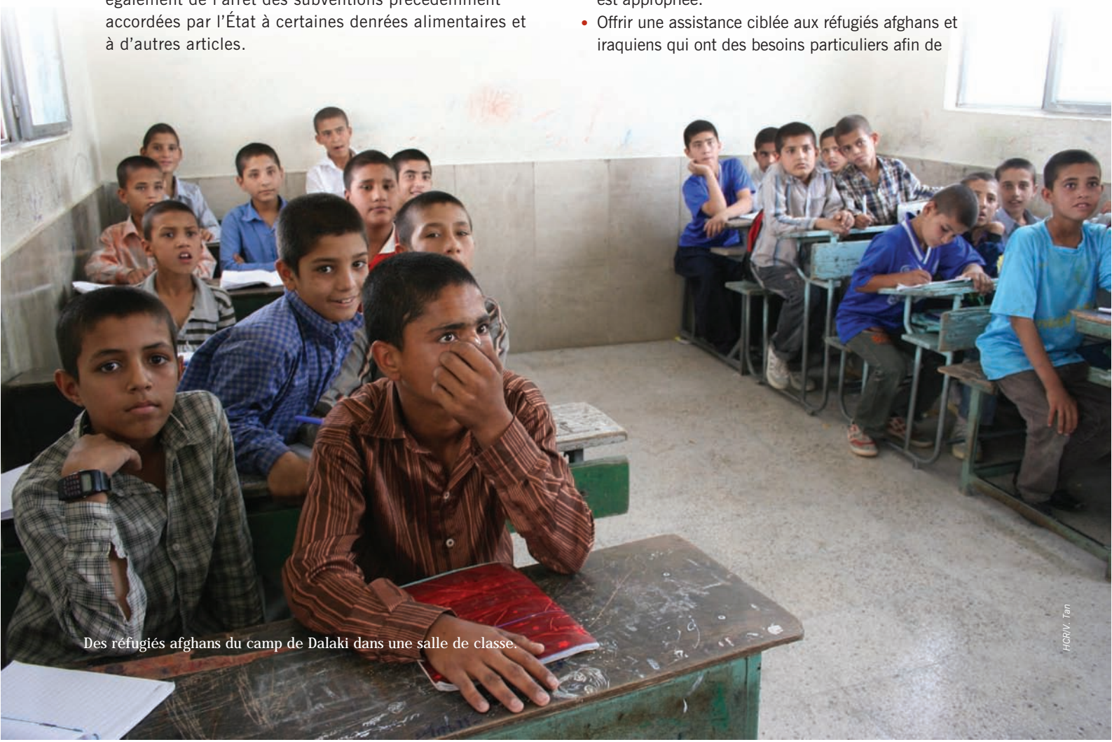
Des réfugiés afghans du camp de Dalaki dans une salle de classe.