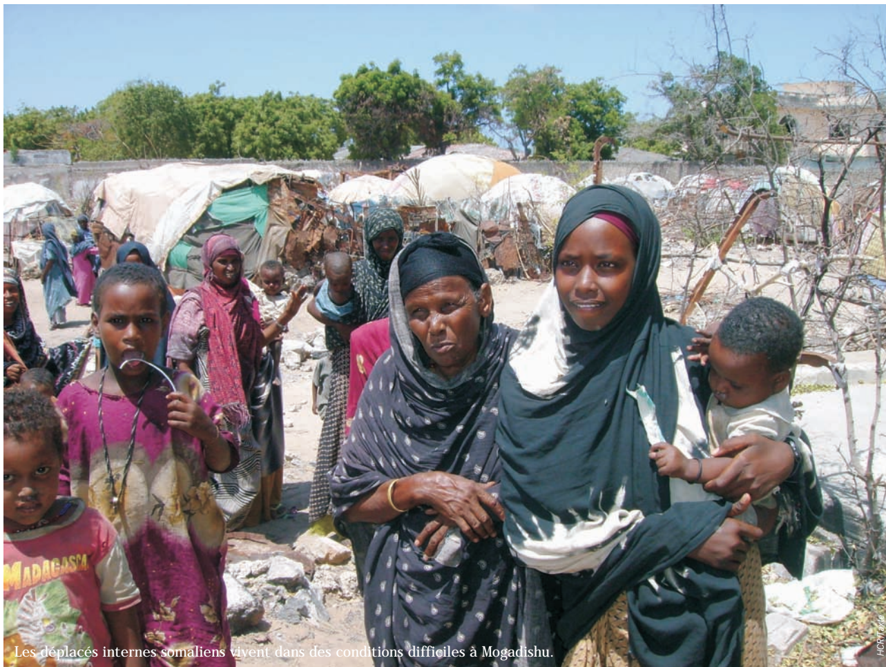
Les déplacés internes somaliens vivent dans des conditions difficiles à Mogadishu.