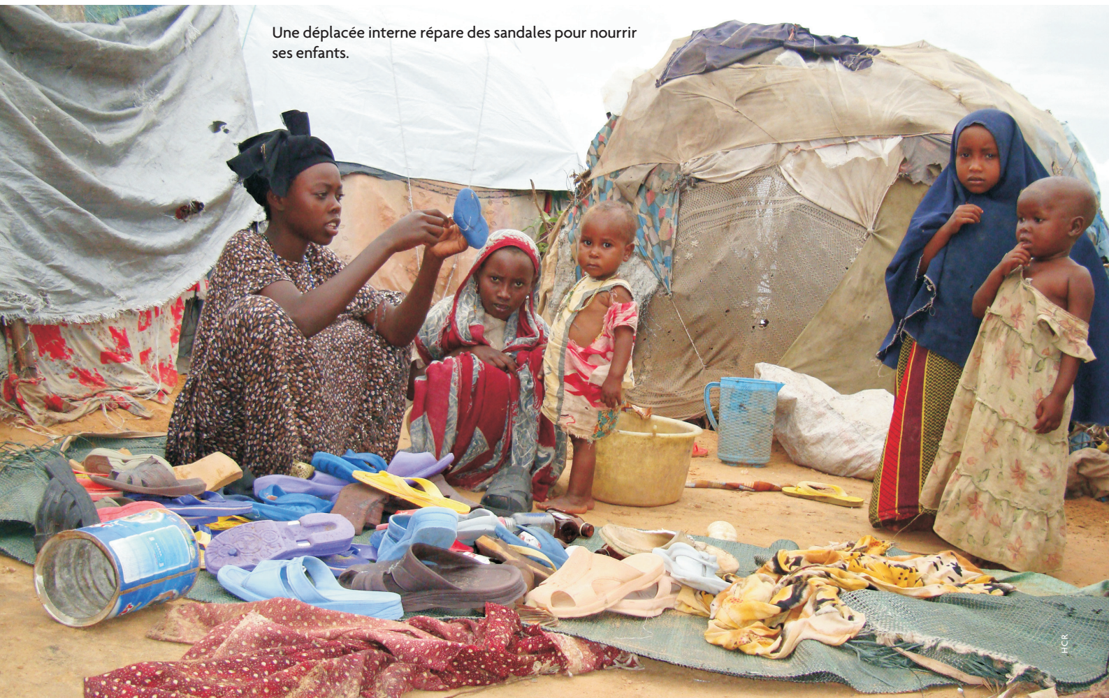
Une déplacée interne répare des sandales pour nourrir ses enfants.