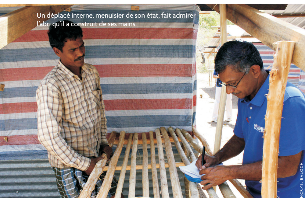
Un déplacé interne, menuisier de son état, fait admirer l'abri qu'il a construit de ses mains.