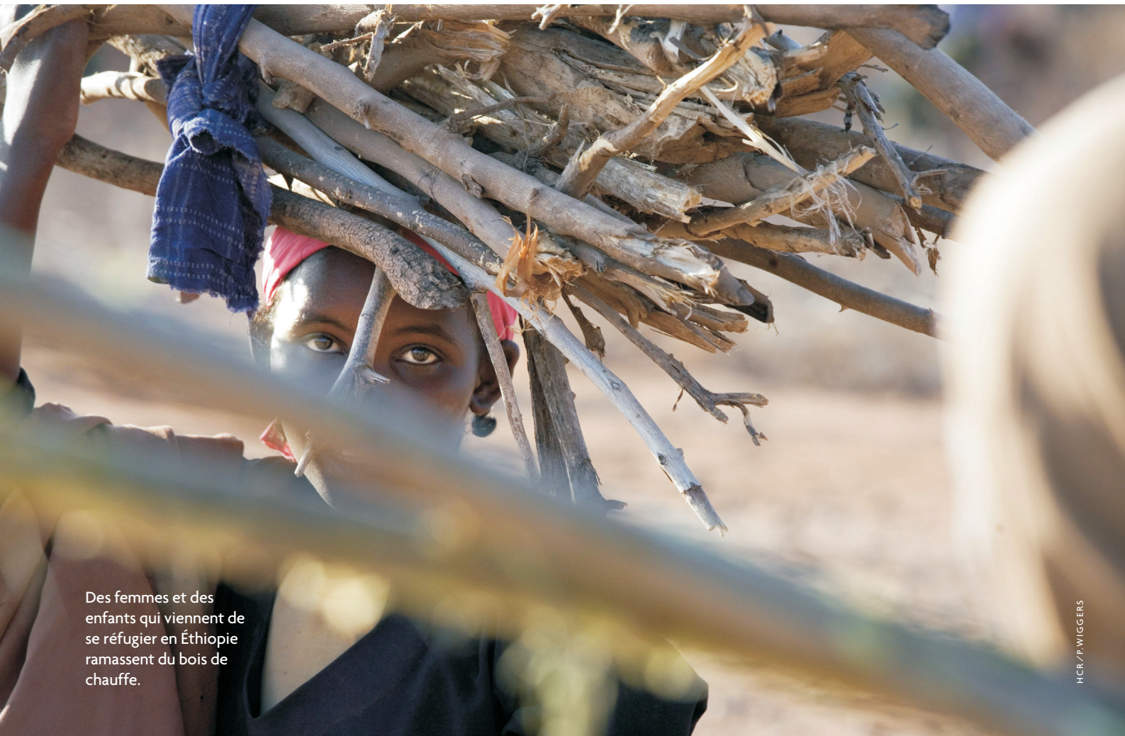
Des femmes et des enfants qui viennent de se réfugier en Éthiopie ramassent du bois de chauffe.