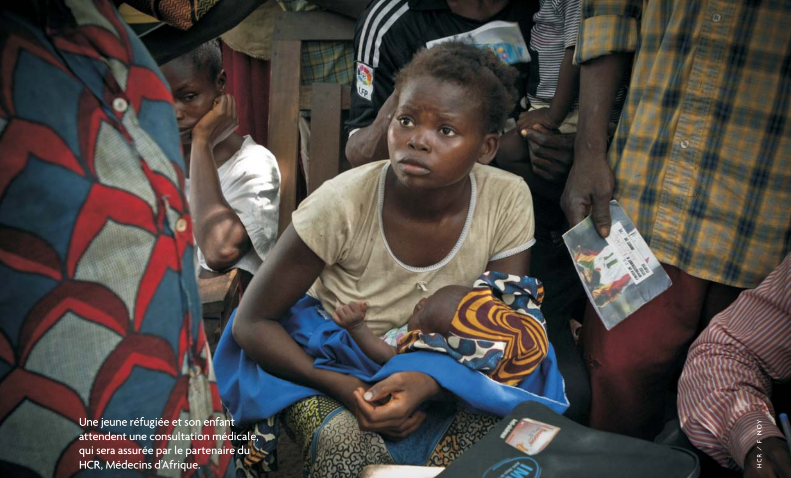
Une jeune réfugiée et son enfant attendent une consultation médicale, qui sera assurée par le partenaire du HCR, Médecins d'Afrique.

également consolider les activités destinées à favoriser l'intégration sur place des réfugiés ruraux vivant dans ces secteurs. Enfin, le HCR se proposait de renforcer la capacité des autorités en ce qui concerne la détermination du statut, pour que les personnes relevant de sa compétence bénéficient d'une assistance juridique.