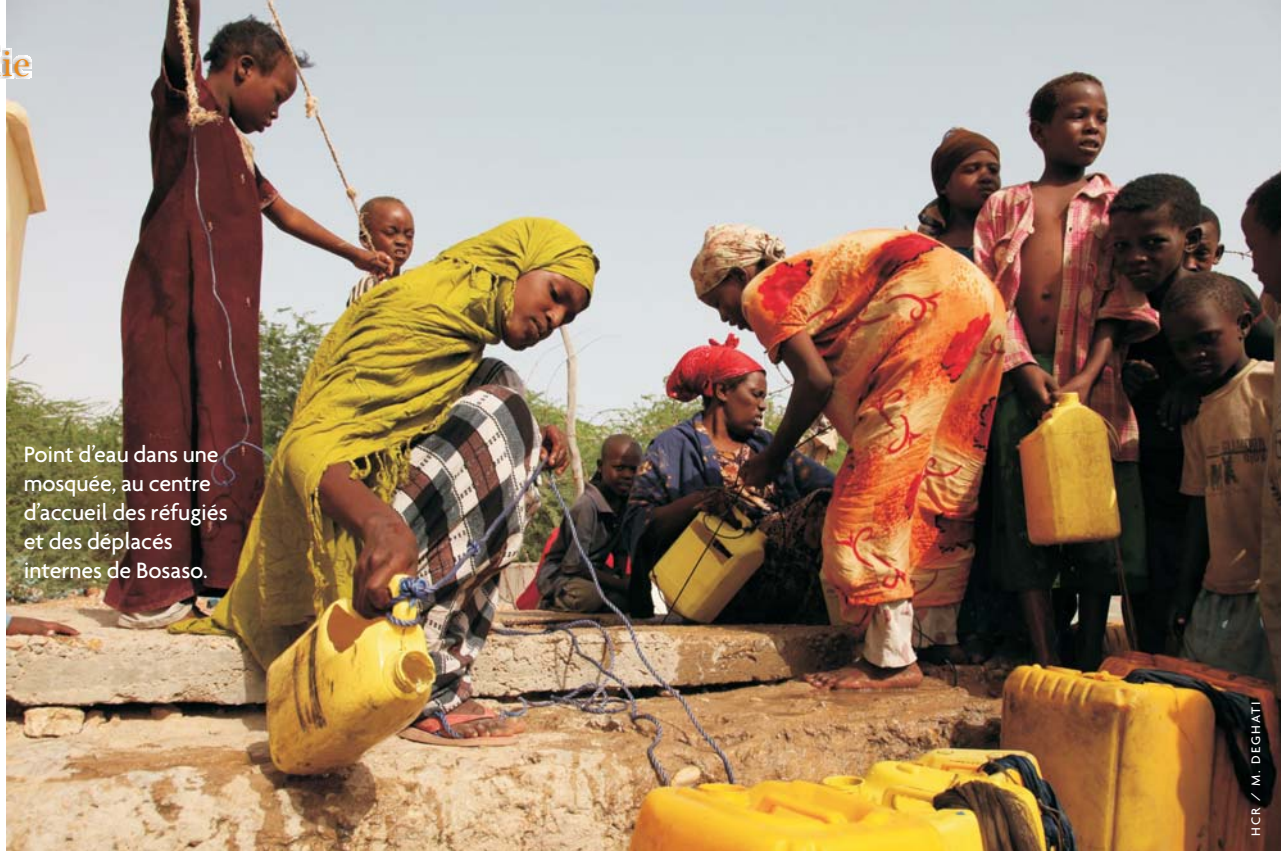
Point d'eau dans une mosquée, au centre d'accueil des réfugiés et des déplacés internes de Bosaso.