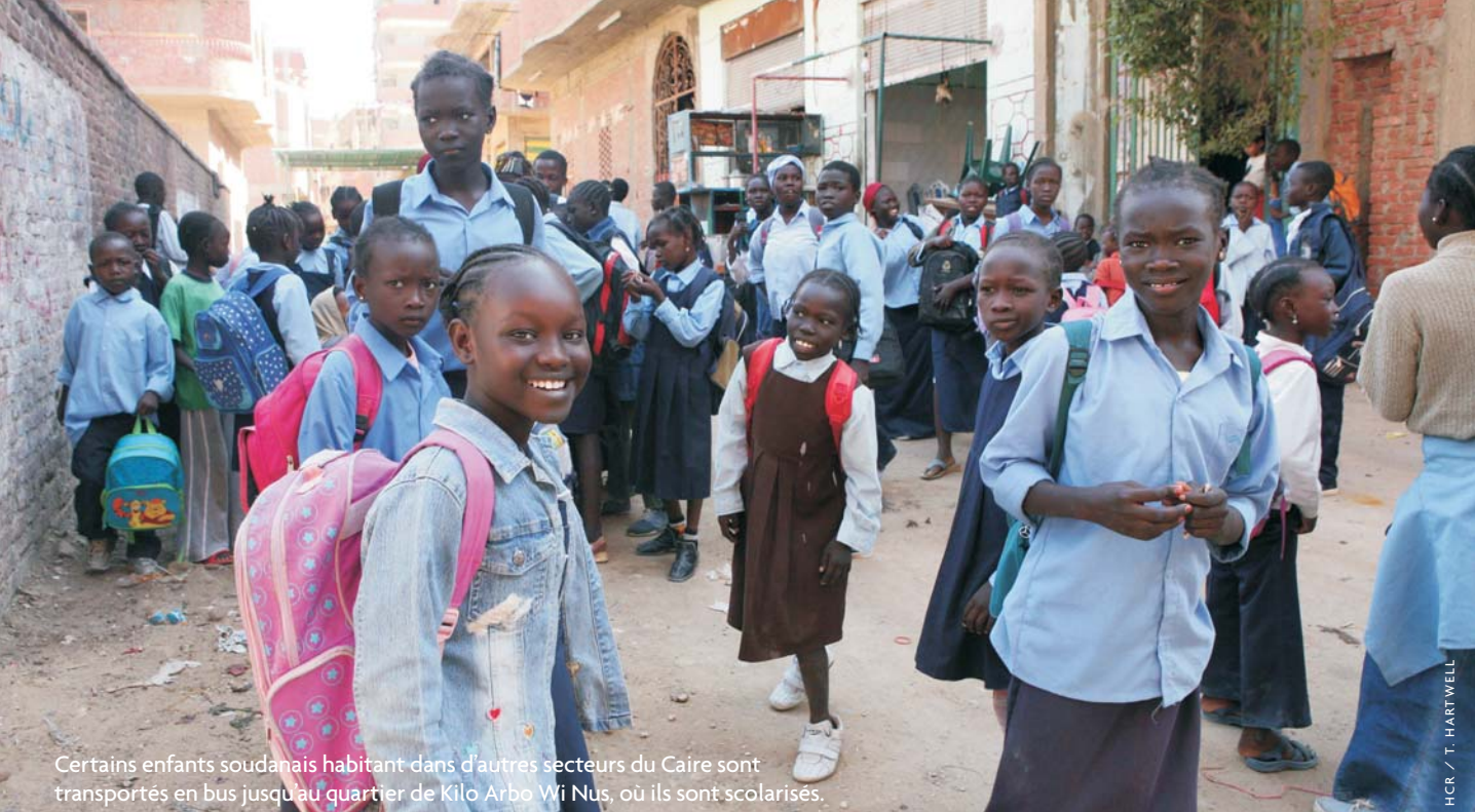
Certains enfants soudanais habitant dans d'autres secteurs du Caire sont transportés en bus jusqu'au quartier de Kilo Arbo Wi Nus, où ils sont scolarisés.