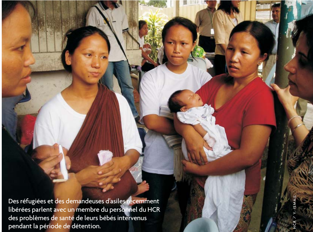
Des réfugiées et des demandeuses d'asiles récemment libérées parlent avec un membre du personnel du HCR des problèmes de santé de leurs bébés intervenus pendant la période de détention.

Parmi les principaux objectifs du HCR figuraient également la lutte contre la violence sexuelle et sexiste et la promotion de l'autosuffisance des femmes réfugiées. La recherche de solutions locales temporaires pour différents groupes, et en particulier pour les Rohingyas du Myanmar, constituait également une priorité ; cependant, les efforts entrepris dans ce sens n'ont pas encore produit les résultats escomptés.