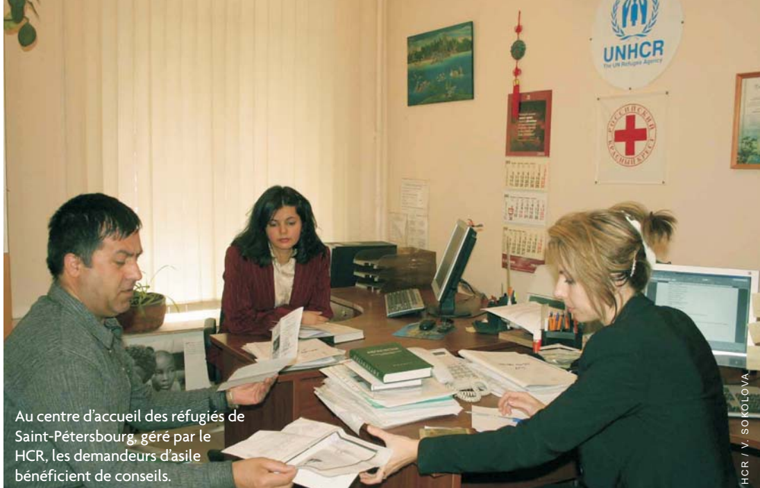
Au centre d'accueil des réfugiés de Saint-Petersbourg, géré par le HCR, les demandeurs d'asile bénéficient de conseils.

La Fédération de Russie a naturalisé 369 réfugiés au cours de l'année. Le HCR a trouvé des opportunités de réinstallation pour 280 réfugiés qui ne pouvaient pas s'intégrer localement ou être rapatriés. Quelque 60 personnes ont choisi le rapatriement librement consenti, principalement vers l'Afghanistan.