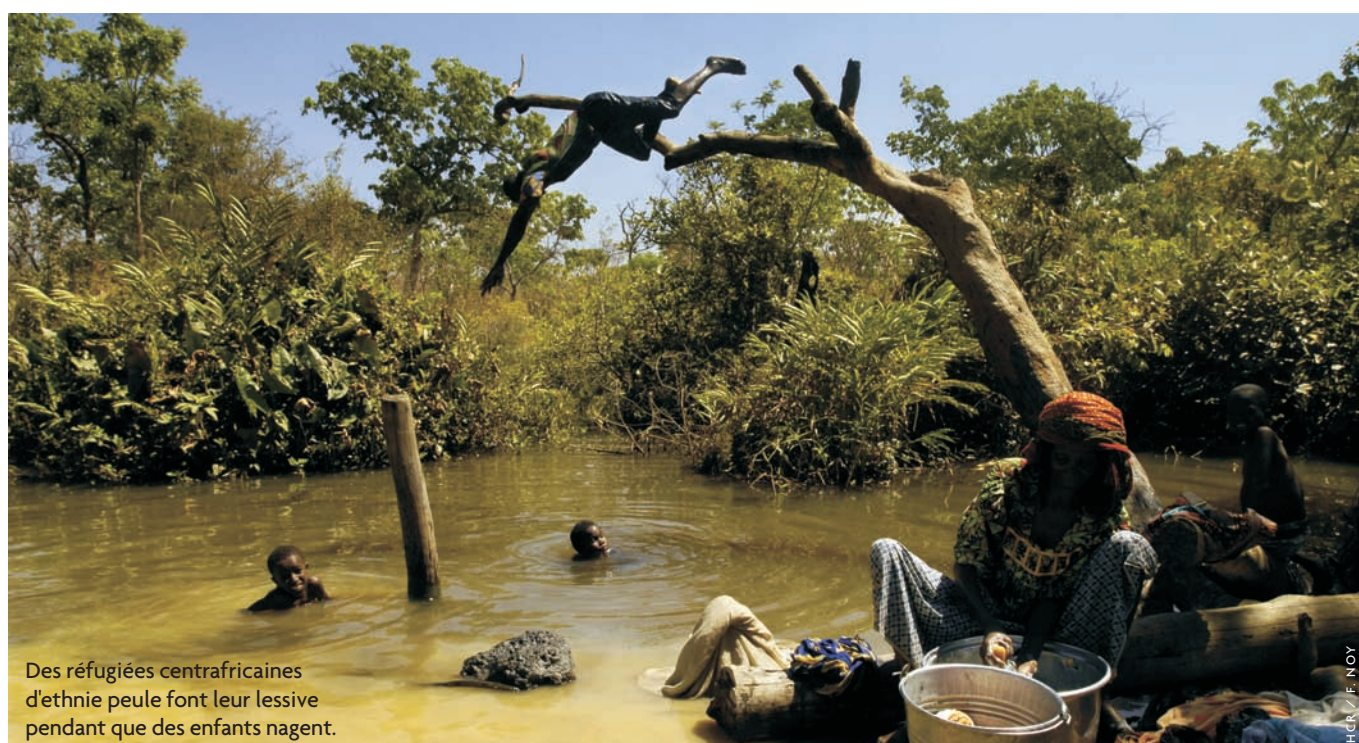
Des réfugiées centrafricaines d'ethnie peule font leur lessive pendant que des enfants nagent.

La sécurité à l'intérieur et aux alentours des camps, ainsi que l'accès de la communauté humanitaire aux camps dans de bonnes conditions de sécurité, devraient continuer à poser des problèmes en 2011, d'autant que la Mission des Nations Unies en République centrafricaine et au Tchad (MINURCAT) doit se retirer d'ici à la fin de l'année 2010. Le soutien d'un mécanisme de sécurité approprié, comme le Détachement intégré de sécurité (DIS) créé par le Gouvernement tchadien avec l'appui de