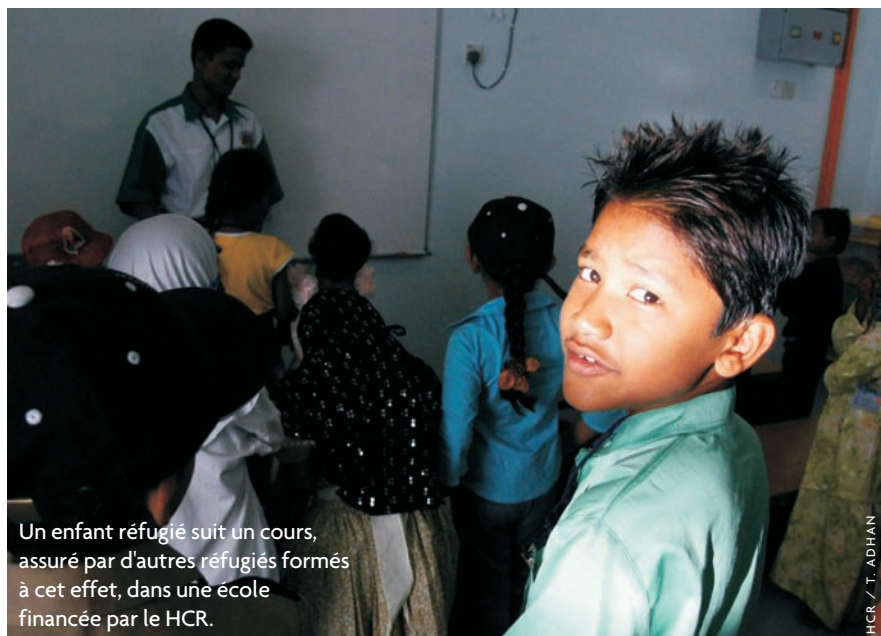
Un enfant réfugié suit un cours, assuré par d'autres réfugiés formés à cet effet, dans une école financée par le HCR.

de la situation permet d'envisager un rapatriement sans danger. Pour la majorité des réfugiés, l'intégration sur place n'est pas considérée comme une option viable par les autorités. Compte