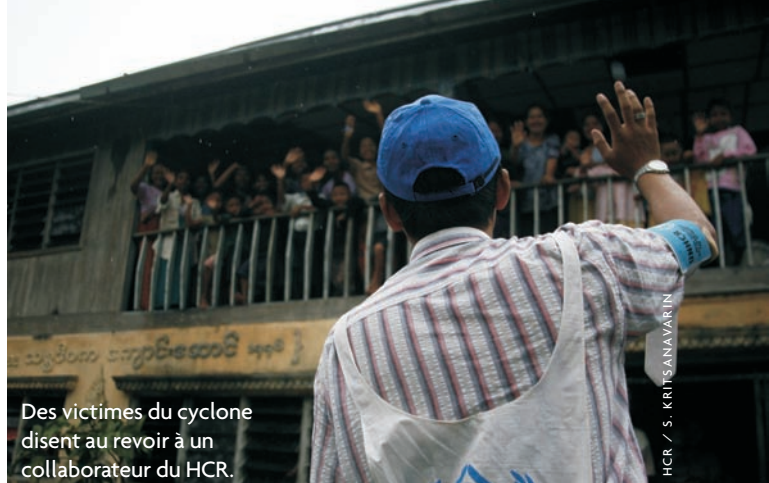
Des victimes du cyclone disent au revoir à un collaborateur du HCR.

L'accès à de vastes zones du nord de l'État de Rakhine demeure difficile en raison de l'éloignement des villages, de l'absence de routes dans certains secteurs et de l'état impraticable des voies de communication durant la saison des pluies. Le HCR et ses partenaires sont souvent contraints d'avoir recours à des bateaux, tandis que certains villages ne sont accessibles qu'à pied. De plus, les limites imposées par le Gouvernement concernant le nombre d'organisations autorisées à opérer dans la région entravent l'assistance humanitaire et le suivi des conditions de protection.