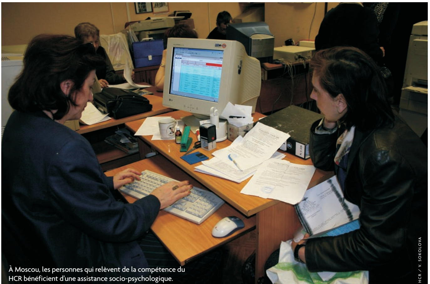
À Moscou, les personnes qui relèvent de la compétence du HCR bénéficient d'une assistance socio-psychologique.