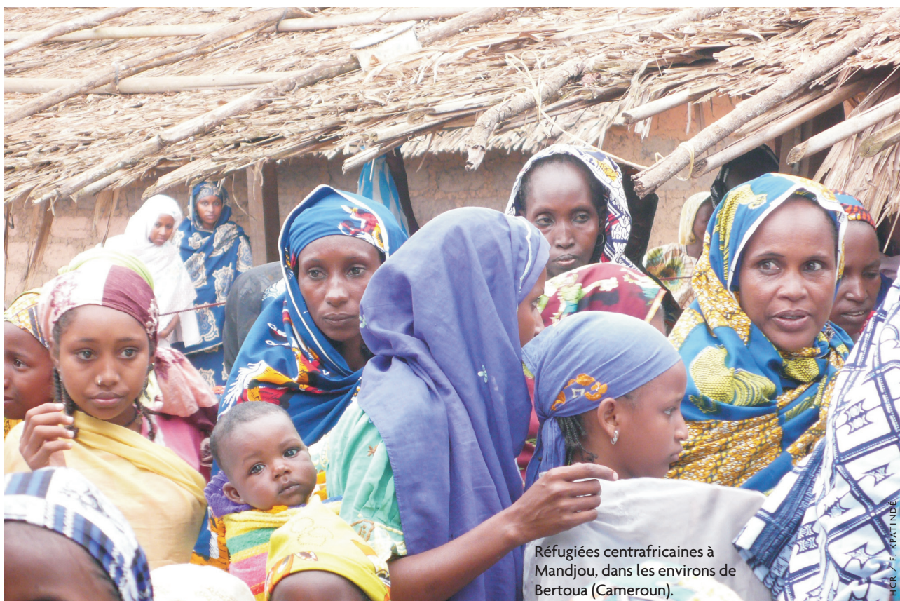
Réfugiées centrafricaines à Mandjou, dans les environs de Bertoua (Cameroun).