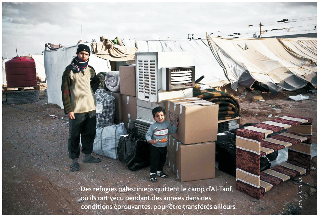
Des réfugiés palestiniens quittent le camp d'Al-Tanf, où ils ont vécu pendant des années dans des conditions éprouvantes, pour être transférés ailleurs.