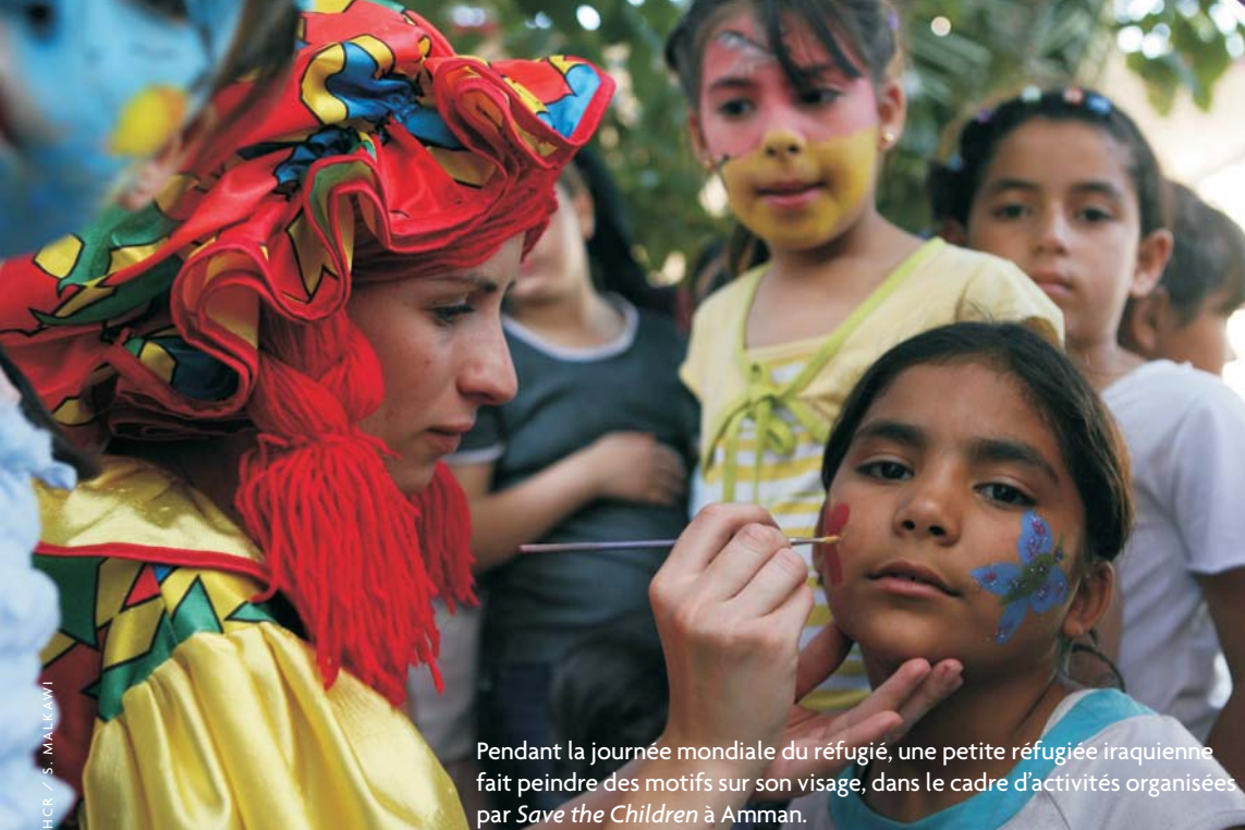
Pendant la journée mondiale du réfugié, une petite réfugiée iraquienne fait peindre des motifs sur son visage, dans le cadre d'activités organisées par Save the Children à Amman.

statut et permet aux réfugiés reconnus en vertu du mandat du HCR de rester au maximum six mois après leur reconnaissance, période durant laquelle une solution durable doit être trouvée. À l'heure actuelle, la réinstallation est la seule solution possible pour la majorité des réfugiés, car les conditions qui règnent en Iraq ne permettent pas de retours à grande échelle et il n'existe pas de possibilités d'intégration sur place en Jordanie.