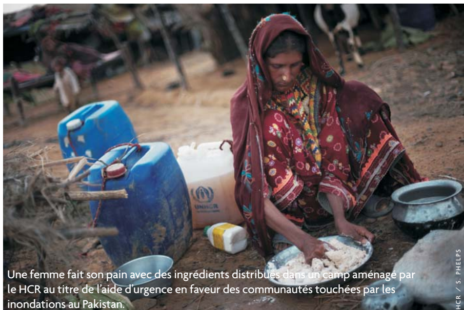
Une femme fait son pain avec des ingrédients distribués dans un camp aménagé par le HCR au titre de l'aide d'urgence en faveur des communautés touchées par les inondations au Pakistan.