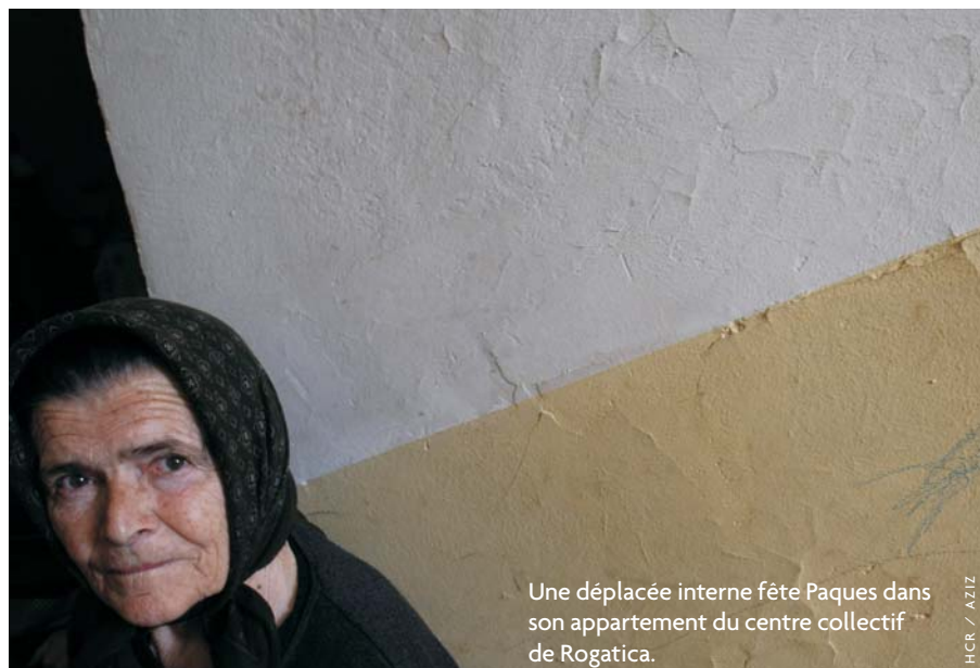
Une déplacée interne fête Paques dans son appartement du centre collectif de Rogatica.