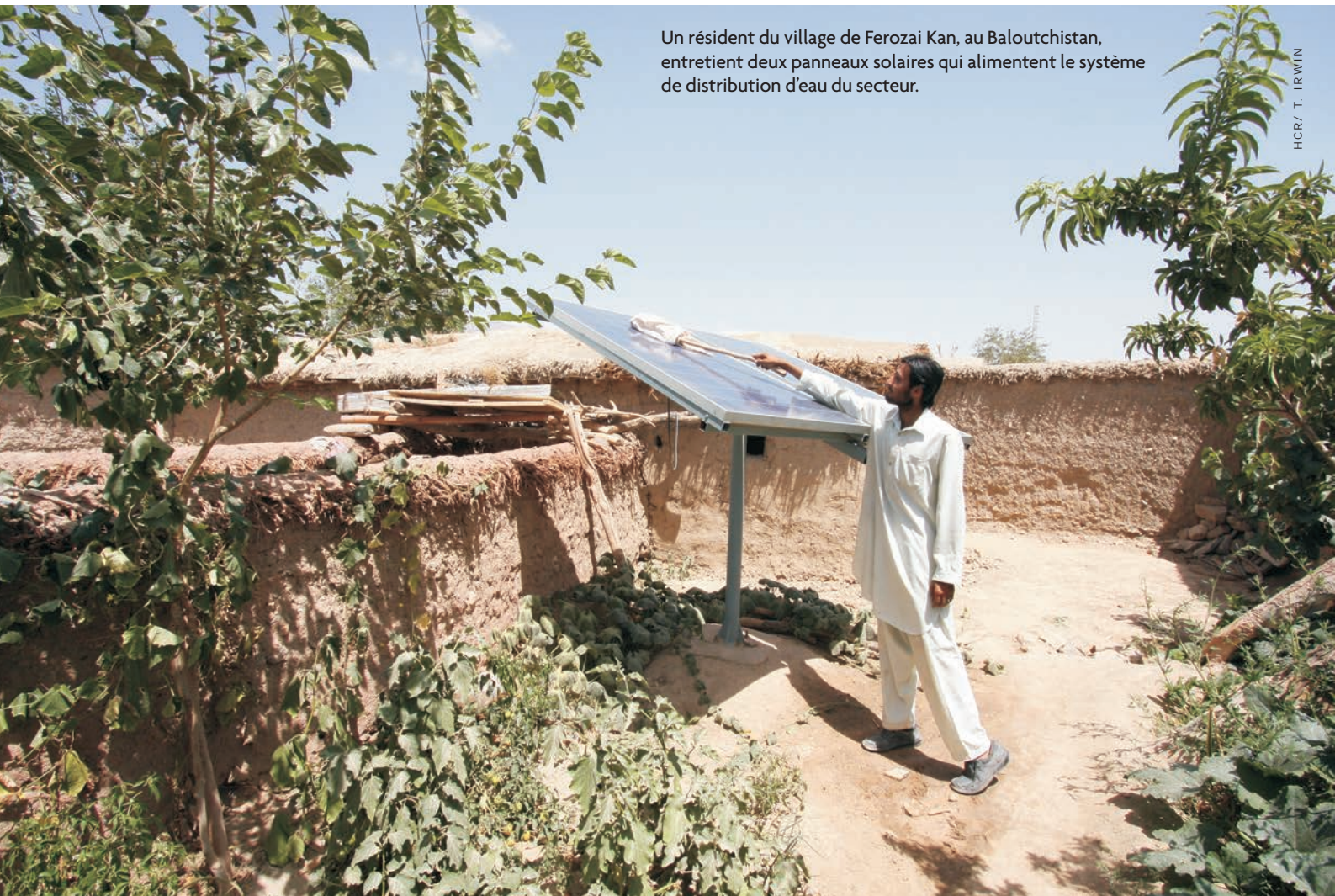
Un résident du village de Ferozai Kan, au Baloutchistan, entretient deux panneaux solaires qui alimentent le système de distribution d'eau du secteur.