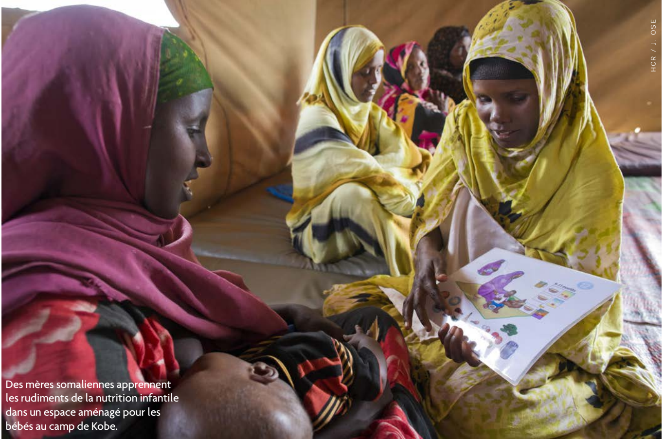
Des mères somaliennes apprennent les rudiments de la nutrition infantile dans un espace aménagé pour les bébés au camp de Kobe.

sont arrivées en moyenne chaque semaine. La plupart des réfugiés sont des femmes et des enfants.