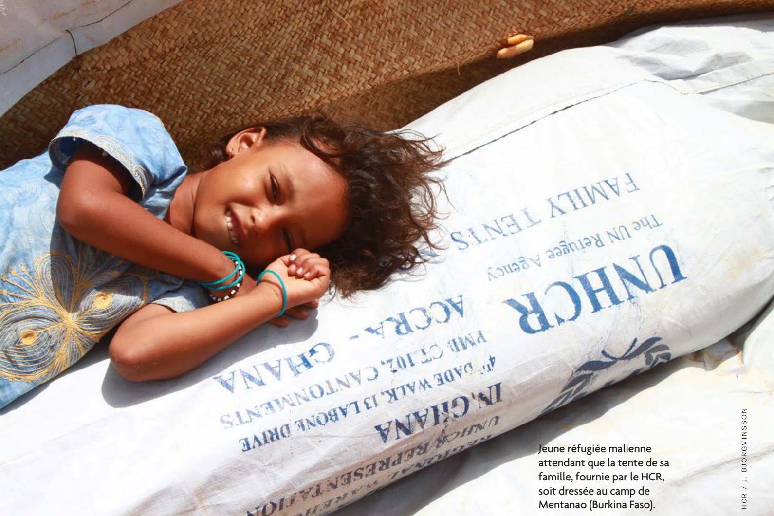
Jeune réfugiée malienne attendant que la tente de sa famille, fournie par le HCR, soit dressée au camp de Mentanao (Burkina Faso).