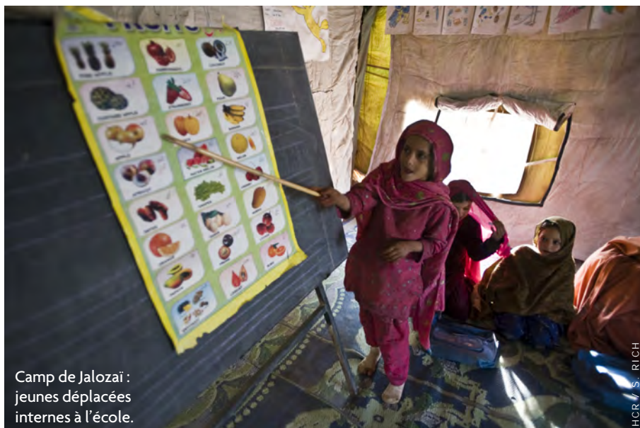
Camp de Jalozaï : jeunes déplacées internes à l'école.

Alfalah Development Foundation Alisei, Italie American Refugee Committee Awaz Welfare Organization Basic Education for Afghan Refugees Blue Veins Catholic Relief Services, États-Unis Centre of Excellence for Rural Development Church World Services, États-Unis Citizens' Commission for Human Development Comité international de secours, États-Unis Community Advancement and Rural Empowerment Conseil danois pour les réfugiés Conseil norvégien pour les réfugiés Council for Community Development Dost Welfare Foundation, Pakistan Drugs and Narcotics Educational Services for Humanity Foundation for Rural Development Gender and Reproductive Health Organization Health and Nutrition Development Society Helping Organization for People's Empowerment Hujra Village Support Organization Innovative Development Organization Islamic Educational & Welfare Society Khushal Awareness and Development Organization Koshan Welfare Society Legend Society Motto to Empower the Health, Education & Rights Naveed Khan Foundation Pakistan Community Development Programme Pakistan Rural Development Program Participatory Efforts for Healthy Environment Regional Institute of Policy Research and Training Rural Infrastructure and Human Resource Development Organization Samaj Welfare Council