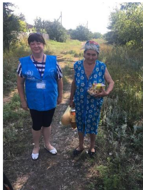
UNHCR та його партнер ГО «Проліска» є єдиними організаціями, які мають доступ до села Спирне, розташованого у близько 30 км від лінії розмежування. У селі залишилися тільки люди похилого віку, які не мають доступу до продовольчих товарів, ліків, транспорту, газу та централізованого опалення. UNHCR через свого партнера надає їм необхідну гуманітарну допомогу та допомогу в сфері захисту.