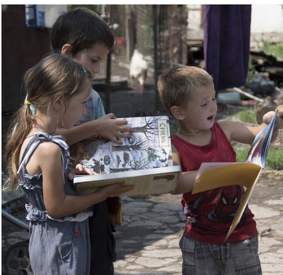
Сім'я з 7 дітьми у с. Троїцьке, розташованому біля лінії розмежування, отримала грошовий грант від UNHCR та книги від партнерів – ГО «Проліска».