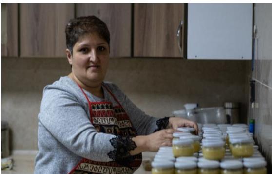
«Բերդի կանանց ռեսուրս կենտրոն» հիմնադրամը տեղահանված կանանց ներգրավել է սոցիալական ծեռնարկատիրության մեջ՝ ՄԱԿ ՓԳՀ-ի՝ հյուրընկալող համայնքներում կարողությունների զարգացման գործողությունների շնորհիվ, Բերդ, Տավուշի մարզ

մասնակցել է ՄԱԿ ՓԳՀ գործընկերոջ՝ Հայկական Կարմիր խաչի ընկերության կողմից հաշվետու ժամանակաշրջանի ընթացքում իրականացված խմբային հոգեբանական սեսիաների: