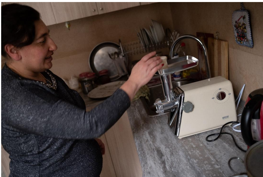
Տեղահանված կինը ստացել է խոհանոցային տեխնիկա՝ ՄԱԿ ՓԳՀ-ի՝ եկամտի ստեղծման գործիքների տրամադրման ծրագրի միջոցով, Դեբեդ, Լոռու մարզ:

Տեղահանված անձանց բարեկեցության և հիմնական կարիքների բավարարման նպատակով ՄԱԿ ՓԳՀ-ն շարունակում է տրամադրել դեպքերի կառավարման և մասնագիտացված ծառայություններ՝ հիմնված իրավական պաշտպանության մշտադիտարկման և օգնության թեժ գծի գործարկման արդյունքների վրա: Կենսապահովման ծրագրերի, ինչպես նաև մասնագիտական դասընթացների և հայոց լեզվի դասընթացների հասանելիության ապահովման հետ մեկտեղ՝ ՄԱԿ ՓԳՀ-ն շարունակում է դրամական աջակցություն ցուցաբերել առավել խոցելի տեղահանված անձանց: Կարևոր գործողություն է լինելու նաև երեխաների պաշտպանության կարիքների վերհանման և գենդերահեն բռնության զոհերի վաղ հայտնաբերման ու արձագանքման համապատասխան գործողությունների կազմակերպման թեմաներով գործընկեր կազմակերպությունների կարողությունների զարգացումը: