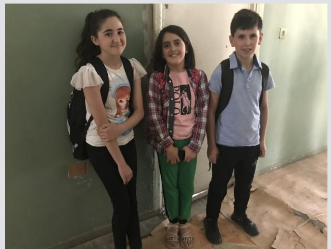
Լեռնային Ղարաբաղից Հայաստան տեղահանված ընտանիքների դպրոցահասակ երեխաներ ք. Աբովյան, Կոտայքի մարզ, 2021 թ. հունիս

Են սկսել գործել Հայաստանում: Սյունիքի մարզում տեխնիկական օժանդակություն է տրամադրվել երկու համայնքապետարանի և հինգ համայնքային կազմակերպության : Սիսիան և Գորիս քաղաքներում մեկնարկեց մանկական խաղախրապարակներով համալրված երկու մարզադաշտերի շինարարությունը: