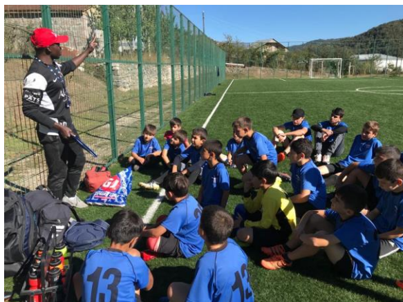
Կոտ դ'Իվուարից փախստականը մարզում է պատանի ֆուտբոլիստների իր թիմը Թեղուտ գյուղում, 2021 թ. օգոստոս.