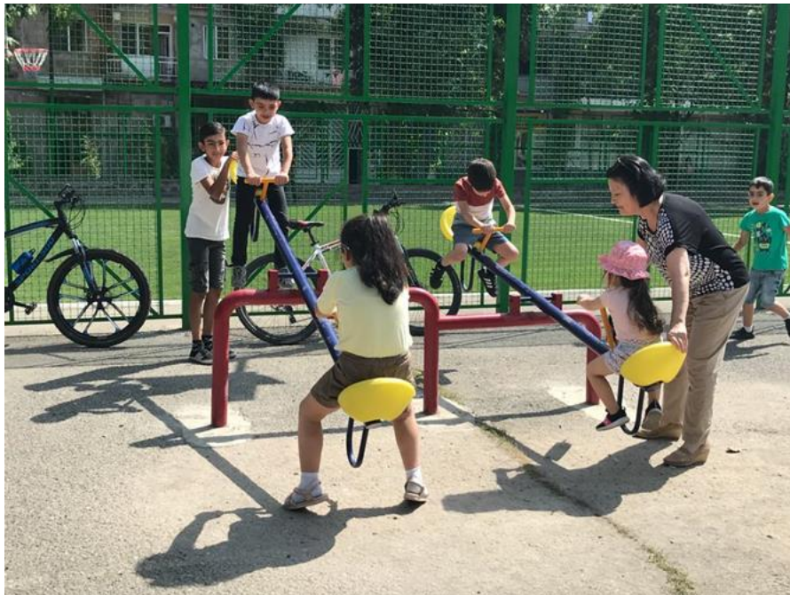
ԼՂ հակամարտության հետևանքով տեղահանված երեխաները խաղում են տեղացի երեխաների հետ ՄԱԿ ՓԳՅ-ի կողմից կառուցված իրենց նոր խաղահրապարակում: Գորիս, Սյունիքի մարզ, 2021 թ. սեպտեմբեր

ՄԱԿ ՓԳՅ-ն և գործընկերներն աշխատում են պաշտպանության միջավայրի բարելավման ուղղությամբ՝ միևնույն ժամանակ աջակցություն ցուցաբերելով նրանց, ովքեր առավելագույն ռիսկի են ենթարկվում: ՄԱԿ ՓԳՅ-ն շարունակում է նպաստել մտահոգության ներքո գտնվող անձանց ազգային արձագանքման ծրագրերում ընդգրկման գործին, ներառյալ COVID-19-ից վերականգնման և վարակի դեմ պատվաստման ծրագրերը և այլ օրենսդրական ու վարչական բարեփոխումները: