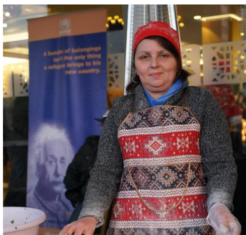
ԼՂ-ից տեղահանված կինն ավանդական կարկանդակ է պատրաստում ՄԱԿ-ի հայաստանյան գրասենյակի եւ «Ավորա» մարդասիրական նախաձեռնության կողմից 2021 թ. դեկտեմբերին կազմակերպված սուրբծննդյան տոնավաճառի ժամանակ:

փաթեթներ են տրամադրվել փախստականի իրավիճակում գտնվող անձանց՝ Հայկական կարմիր խաչի ընկերության կողմից: