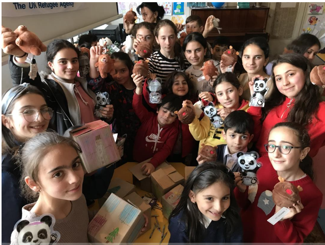
ԼՂ-ից տեղահանված երեխաները տոնում են Սուրբ Ծնունդը Սյունիքի մարզի Գորիս քաղաքի մանկական կենտրոնում: Դեկտեմբեր, 2021, © ՄԱԿ ՓԳՑ/Մնահիտ Հայրապետյան

ՄԱԿ ՓԳՑ-ն ու իր գործընկերներն աշխատում են պաշտպանության միջավայրի կատարելագործման ուղղությամբ, միեւնույն ժամանակ աջակցելով առավել ռիսկային խմբերին: ՄԱԿ ՓԳՑ-ն հանդես է գալիս ի շահ մտահոգության ներքո գտնվող անձանց ներառմանը ազգային արձագանքման ծրագրում, ներառյալ՝ COVID-19 վերականգնման եւ պատվաստման, օրենսդրական ու վարչական այլ բարեփոխումներում: