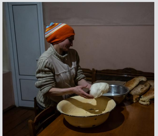
Տեղահանված կինը հաց է թխում իր մեծ, բազմասերունդ ընտանիքի համար: Գետահովիտ գյուղ, Իջեւան, Տավուշի մարզ, փետրվար 2022 թ.:

Կանխարգելում. ՄԱԿ ՓԳՅ-ն եւ գործընկերները տարածում են COVID-19-ի կանխարգելման վերաբերյալ ԱՀԿ տեղեկատվական թերթիկները եւ պաստառները, համայնքապետարաններին եւ ժամանակավոր կացարաններում բնակվող անձանց բաժանում դիմակներ եւ այլ պաշտպանիչ պարագաներ: