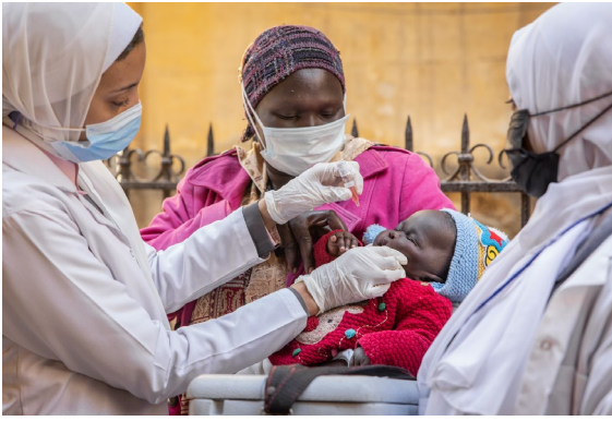
طفل لاجئ يتلقى لقاح شلل الأطفال كجزء من جهود وزارة الصحة والسكان لتطعيم جميع الأطفال في مصر.