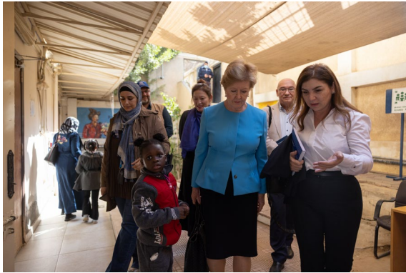
مساعدة المفوض السامي للحماية خلال زيارتها للمبنى الرئيسي بمدينة ٦ أكتوبر