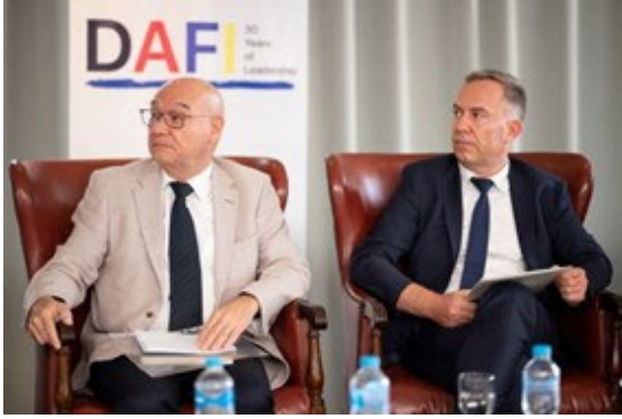
احفظت هيئة الإغاثة الكاثوليكية، الشريك التنفيذي للمفوضية، بالذكرى الثلاثين لمنحة DAFI بحضور ممثل سفارة ألمانيا وممثل المفوضية في مصر في ٢٦ سبتمبر ٢٠٢٢.