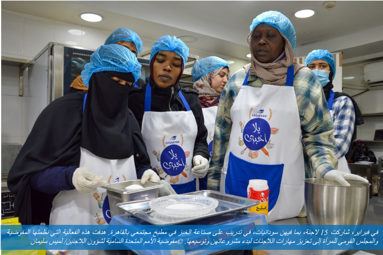
في فبراير، شاركت 15 لائحة، بما فيهن سودانيات، في تدريب على صناعة الخبز في مطبخ مجتمعي بالقاهرة. هدفت هذه الفعالية التي نظمتها المفوضية والمجلس القومي للمرأة إلى تعزيز مهارات اللاجئات لبدء مشروعاتهن وتوسيعها.

في 28 فبراير، عقدت المفوضية وجهاتها الشريكة أول جلسة للمشاركة المجتمعية في ذلك العام قبل إنشاء مكان فيصل الأمن في القاهرة الكبرى. وتعد منطقة فيصل جزءاً من القاهرة الكبرى وتحتوي على عدد كبير من اللاجئين السودانيين. قد حضرت الدورة 32 امرأة سودانية، جميعهن من الوافدات الجدد. وتعد جلسات المشاركة أحد المبادرات التي نفذها الفريق العامل الفرعي المعني بالعنف القائم على النوع الاجتماعي الذي يشترك في رئاسته صندوق الأمم المتحدة للسكان (UNFPA) ومفوضية الأمم المتحدة لشؤون اللاجئين. وفي إطار هذه الجلسة، قدمت المؤسسة المصرية لدعم اللاجئين، والتي تعد أحد الجهات الشريكة للمفوضية، لمحة عامة عن مختلف الإجراءات القانونية، بما تشمل أنواع مختلفة من الوثائق منها محاضر الشرطة، وسجلات المواليد، وإصدارات شهادة الزواج، والطلاق، وإجراءات الحضانة، والتعليمات التي ينبغي اتباعها في حالة الاعتقال لعدم توفر الوثائق، والإقامة، وما إذا كانت مواعيد التسجيل توفر الحماية القانونية من الاعتقال أو الاحتجاز. ثم جاء دور العيادة القانونية بعد الجلسة التوعوية حتى تقدم جلسات مشورة قانونية لـ 38 حالة فردية.