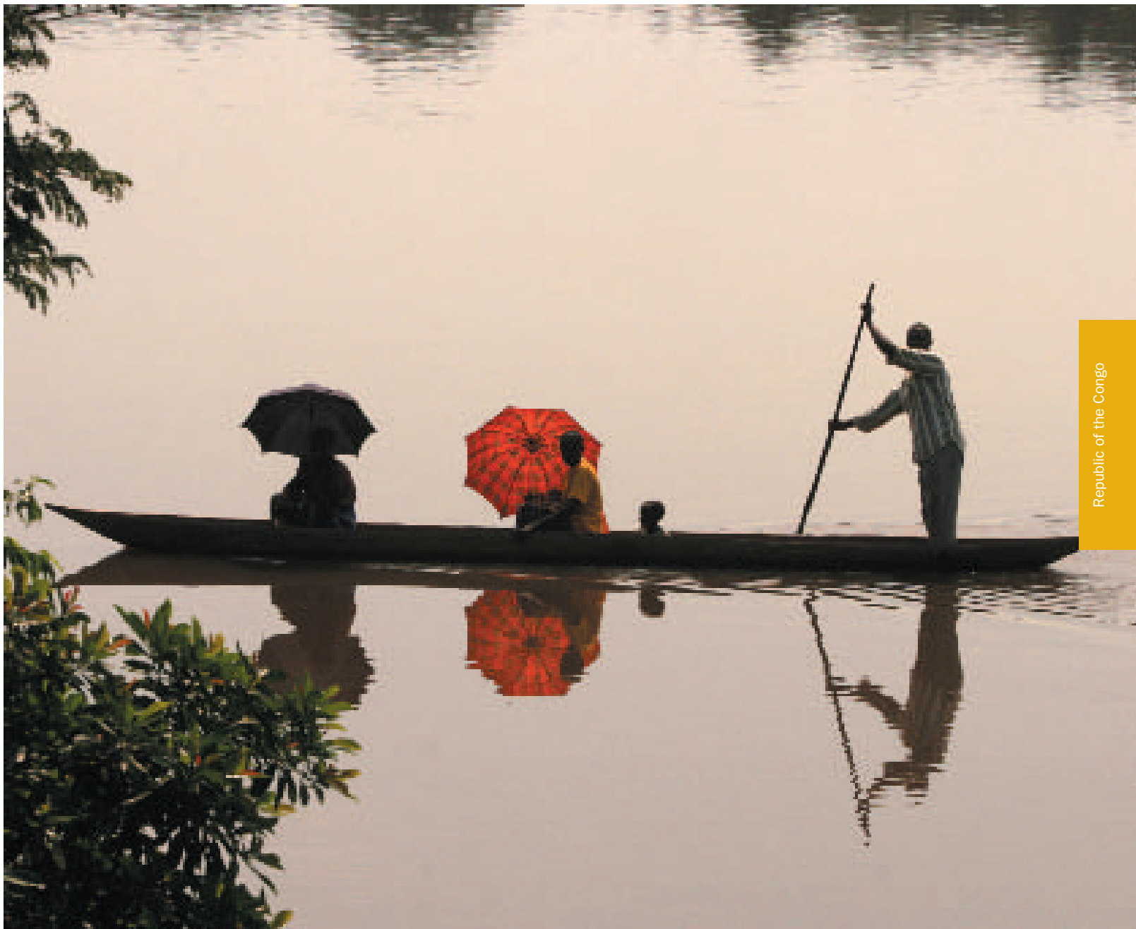
Des réfugiés originaires de la République démocratique du Congo naviguent sur l'Oubangui à bord d'une petite pirogue, non loin d'une zone d'installation de réfugiés située dans le village de Malebo.

demandeurs d'asile, aux réfugiés et aux rapatriés, et d'autre part de mener des activités de promotion des droits de l'homme.