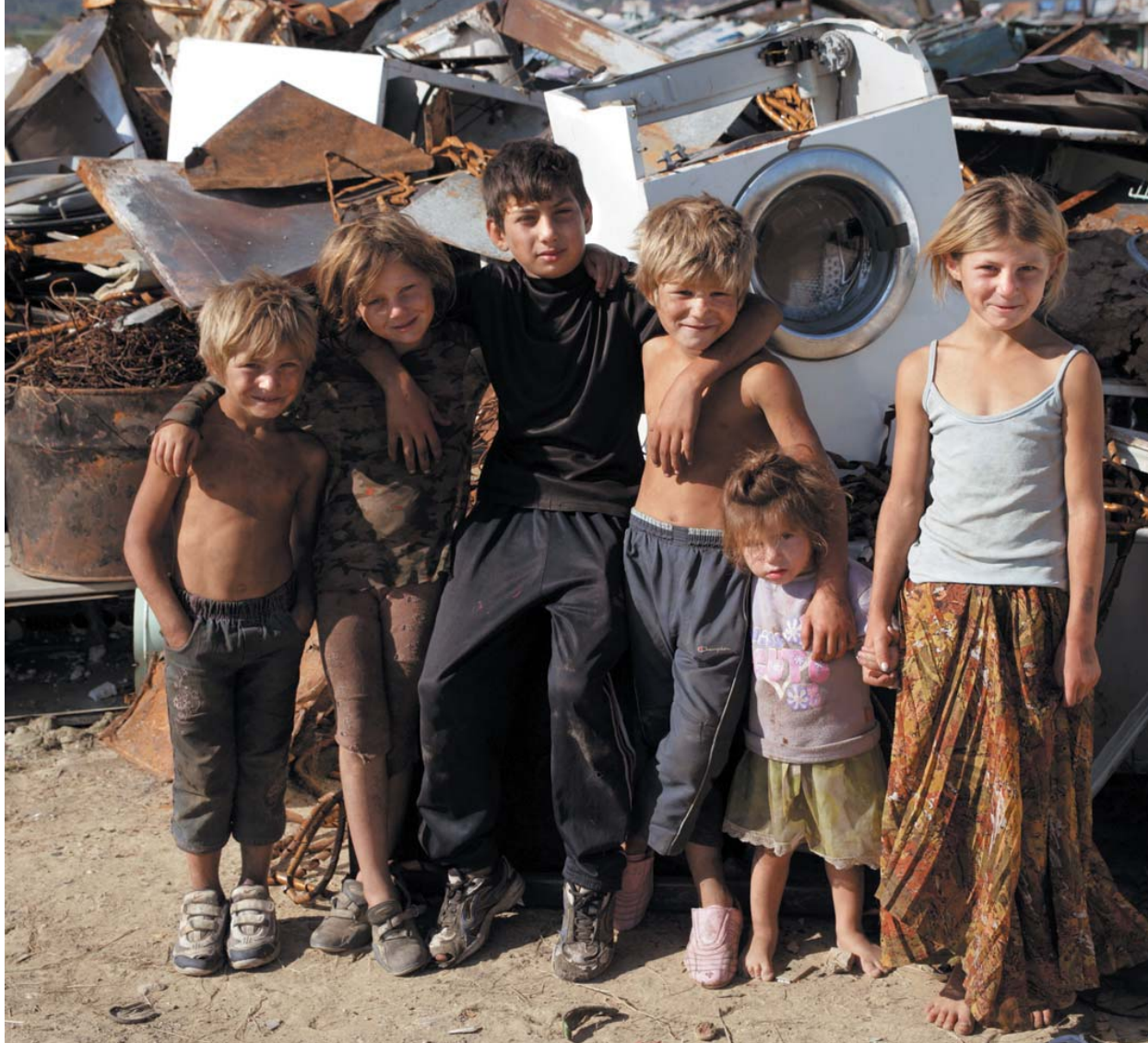
De nombreux Roms ont regagné leur domicile en Bosnie. A présent, il leur faut faire face au défi de la réintégration.