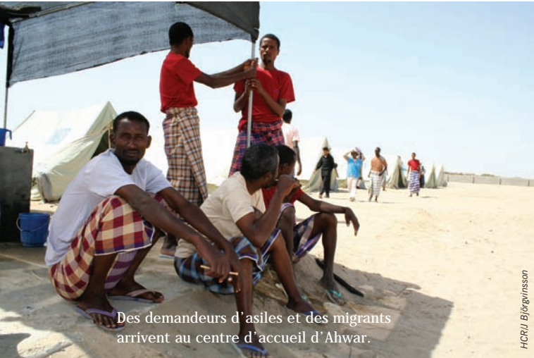
Des demandeurs d'asiles et des migrants arrivent au centre d'accueil d'Ahwar.