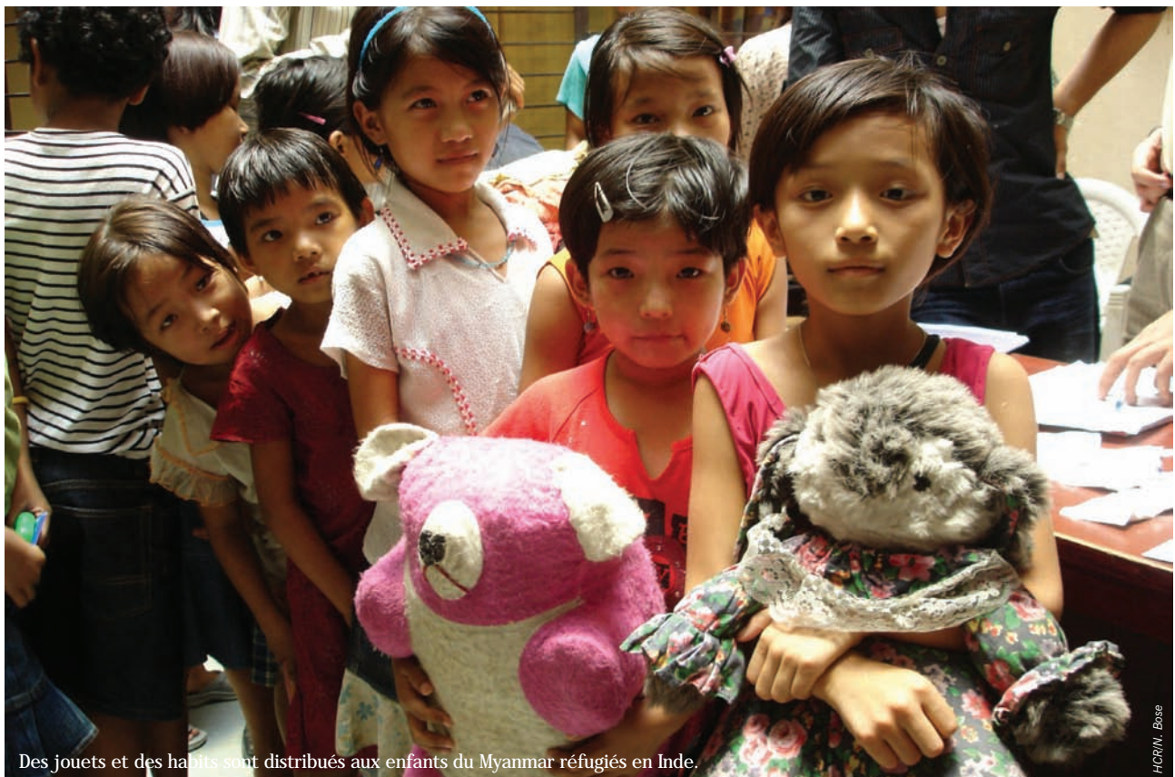
Des jouets et des habits sont distribués aux enfants du Myanmar réfugiés en Inde.

À Sri Lanka, l'action du HCR est entravée par les dangers qui pèsent sur le personnel de l'Organisation et de ses partenaires, ainsi que sur les personnes relevant de sa compétence. L'activité militaire qui règne dans le nord du pays, particulièrement intense en milieu d'année, a gêné la fourniture de l'assistance humanitaire dans les zones proches des lignes de front.