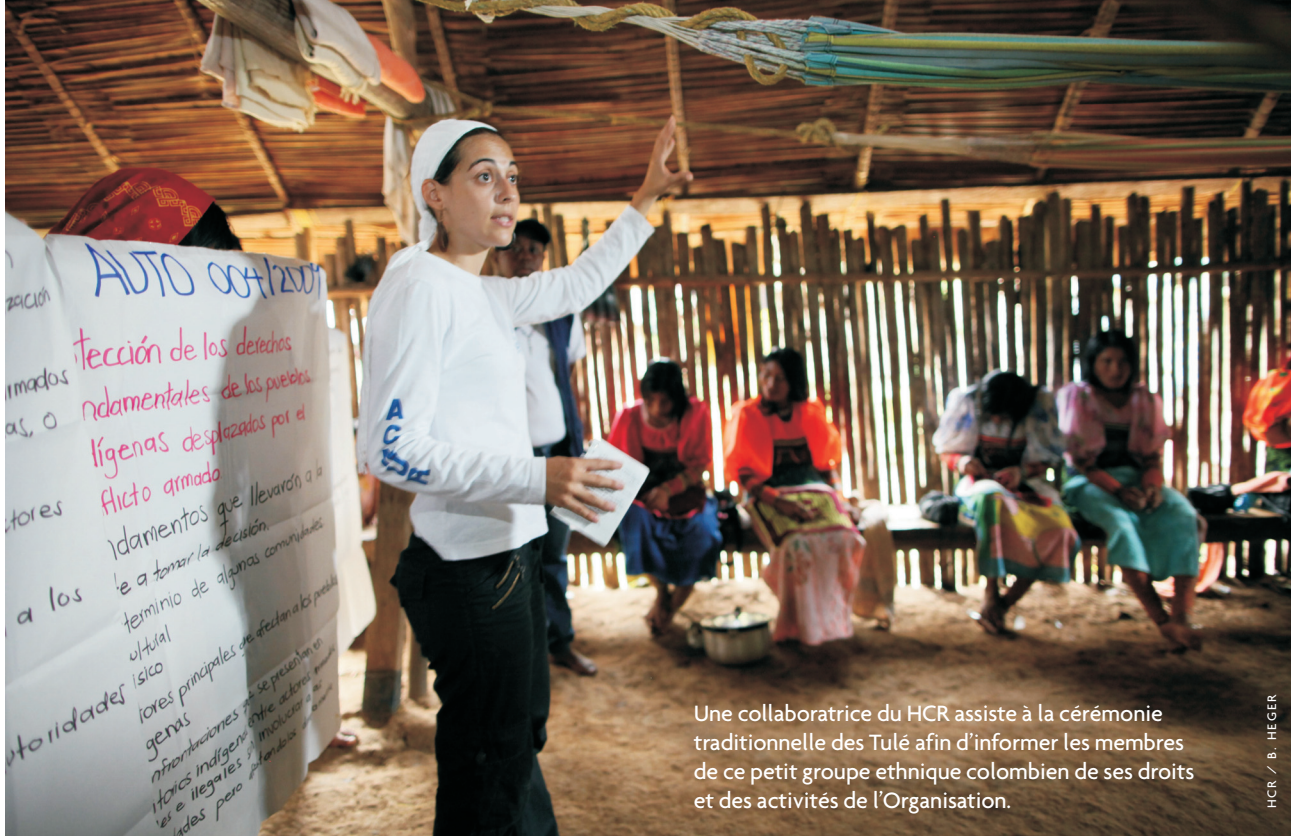
Une collaboratrice du HCR assiste à la cérémonie traditionnelle des Tulé afin d'informer les membres de ce petit groupe ethnique colombien de ses droits et des activités de l'Organisation.