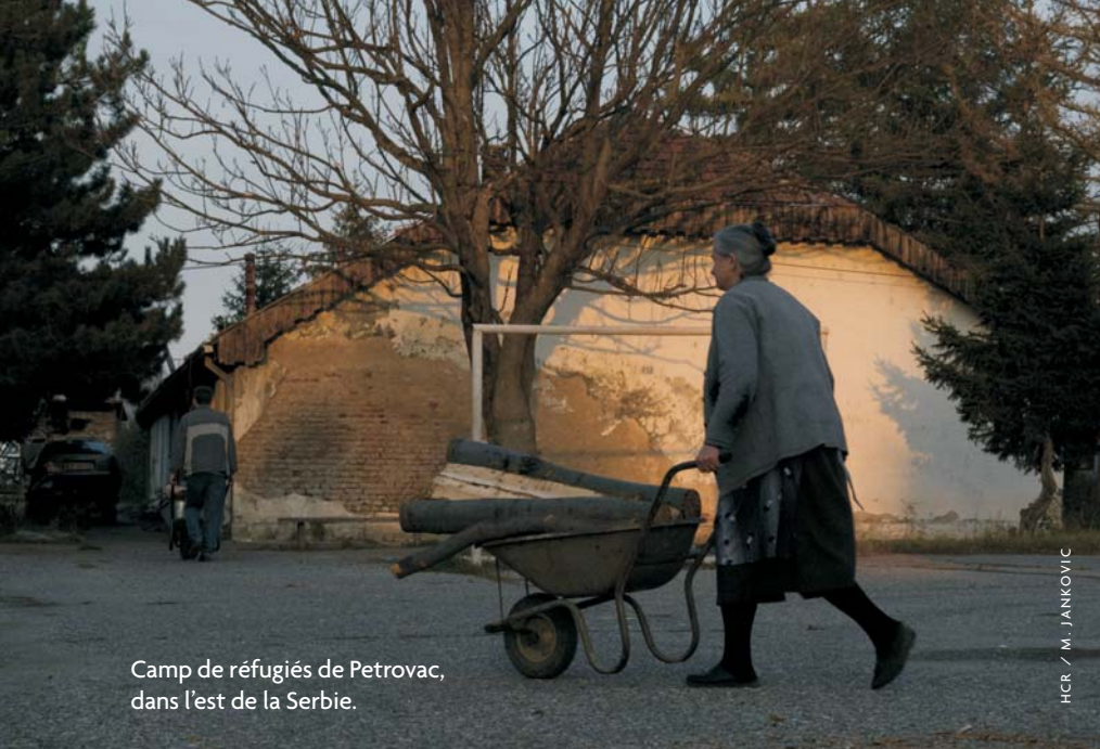
Camp de réfugiés de Petrovac, dans l'est de la Serbie.