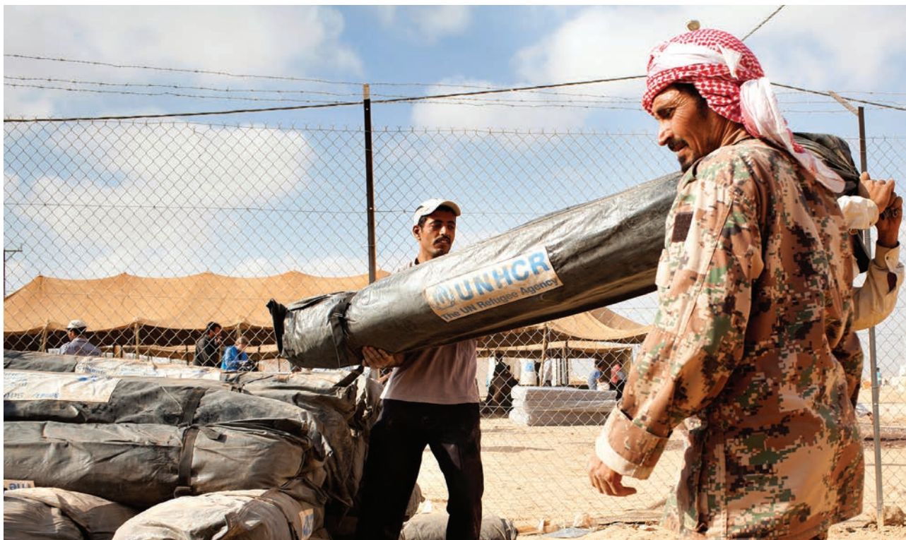
Des réfugiés syriens viennent chercher des tentes dans un centre de distribution du camp de Za'atri (Jordanie).

L E PERSONNEL DU HCR AU SIÈGE, en poste à Genève, à Budapest et dans d'autres capitales régionales, veille par son travail à ce que l'Organisation s'acquitte de son mandat de manière efficace, cohérente et transparente. En 2013, les divisions et les bureaux du Siège ont continué à offrir des orientations et un appui aux opérations sur le terrain, notamment en assumant les fonctions clés décrites ci-après :