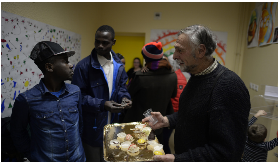
France, 11 janvier 2019. Un village français donne l'exemple pour l'accueil des réfugiés.

pour les employés et les bénévoles non-réfugiés ayant besoin de travailler sur leurs propres représentations mentales, afin d'inclure les personnes réfugiées et en demande d'asile dans leurs équipes en tant que véritables partenaires. Un accompagnement doit être proposé aux bénévoles et aux membres de l'équipe, et les rôles de chacun clairement définis et compris de tous. D'autres mesures peuvent également inclure la mise en place de mécanismes de signalement des abus d'autorité, ainsi que la signature de documents comme des termes de référence ou des codes de conduite, qui définissent précisément le rôle de chacun. Par ailleurs, la connaissance empirique s'impose souvent comme le meilleur moyen de faire face aux inquiétudes : inclure les réfugiés et les demandeurs d'asile dans les équipes bénévoles facilite le changement de posture des équipes.