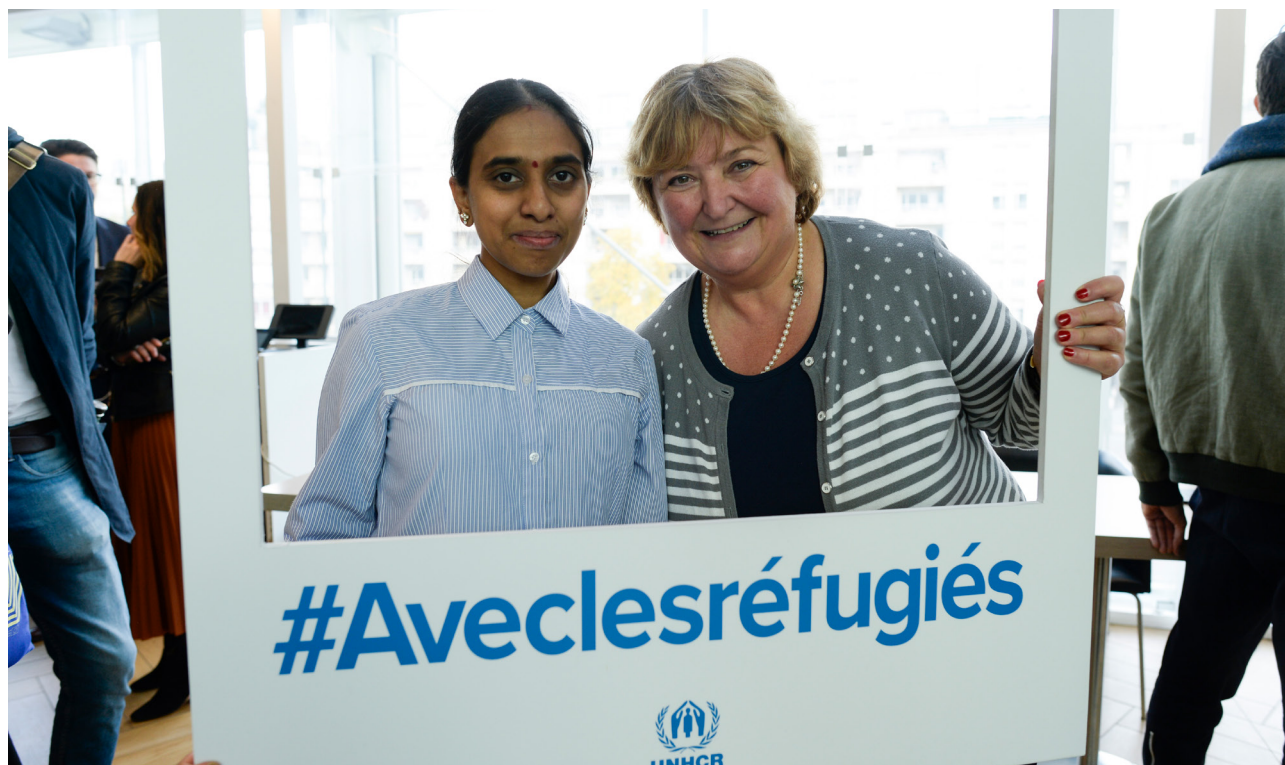
France, 7 novembre 2019. Le HCR et ses partenaires lancent le Train de la Solidarité à Paris

Mené en 2019 et en 2020, ce projet a permis d'étudier le degré de participation des réfugiés et des demandeurs d'asile au sein de nombreuses structures associatives et bénévoles. Il a permis de mieux connaître les initiatives et l'engagement bénévole des personnes réfugiées et en demande d'asile et leur participation dans la construction des solutions. Le rôle crucial joué par les réfugiés dans leur société d'accueil s'est également illustré durant la pandémie de Covid-19, au cours de laquelle de nombreux réfugiés se sont mobilisés pour apporter leur aide en réponse à la crise sanitaire. Cet engagement bénévole a démontré l'importance de s'appuyer sur les compétences des personnes accueillies en France, en leur offrant la possibilité de s'impliquer en tant qu'acteurs légitimes, forts de leurs talents et de leur expertise.