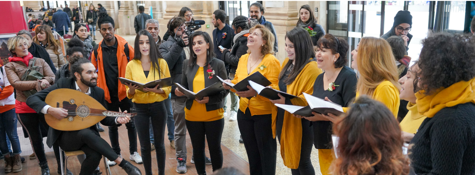
France, 2 décembre 2019. Le chœur de femmes syriennes, Diaconat, chante dans la Gare de Bordeaux Saint Jean tandis que le Train de la Solidarité y fait étape.

Le bénévolat facilite le développement d'un réseau et l'apprentissage des codes, de la culture et de la langue du pays d'accueil. Si les bénévoles réfugiés et en demande d'asile témoignent d'une volonté de contribuer à leur société d'accueil, ils expriment aussi leur besoin de se sentir utiles et valorisés. Cette étude a permis d'identifier les défis les plus fréquents en matière de communication et d'engagement des bénévoles réfugiés et en demande d'asile.