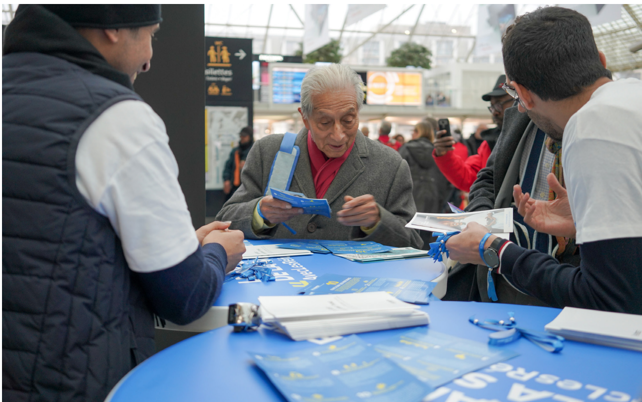
France, 28 novembre 2019. Le Train de la Solidarité commence son parcours à Paris.

53 bénévoles réfugiés et demandeurs d'asile se sont engagés pour participer à l'élaboration et à la réalisation du Train de la Solidarité #Aveclesréfugiés , un projet développé par le HCR, la Délégation interministérielle à l'accueil et à l'intégration des réfugiés (Diair), et le groupe SNCF, en partenariat avec les fondations Sanofi Espoir, Generali-The Human Safety Net, la Fondation SNCF et la Ville de Paris 8 . Le Train de la Solidarité a circulé depuis Paris en passant par Bordeaux et Clermont-Ferrand. Il est arrivé à Genève à l'occasion de la tenue du premier Forum mondial sur les réfugiés les 17 et 18 décembre 2019, un an après l'adoption historique du Pacte mondial sur les réfugiés, dont l'un des objectifs est de renforcer l'autonomie des personnes réfugiées.