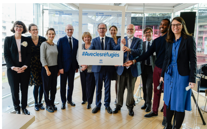
France, 7 novembre 2019. Le HCR et ses partenaires lancent le Train de la Solidarité à Paris

À cette fin, le HCR s'est assuré de l'inclusion des réfugiés dans le processus d'élaboration du Pacte mondial, mais également dans la planification, le suivi et l'évaluation de celui-ci. Durant plusieurs mois, les représentants du Conseil consultatif mondial de la jeunesse (GYAC) mis en place par le HCR ont mené des consultations auprès des communautés de réfugiés, des communautés d'accueil, des responsables communautaires et des autorités gouvernementales afin de recueillir leur avis sur le Pacte mondial sur les réfugiés. A l'occasion du Forum mondial sur les réfugiés qui a eu lieu les 17 et 18 décembre 2019, certains des représentants ont pu s'exprimer avec force sur des questions relatives à la jeunesse réfugiée, l'éducation, les moyens d'existence, ou encore l'énergie et les infrastructures.