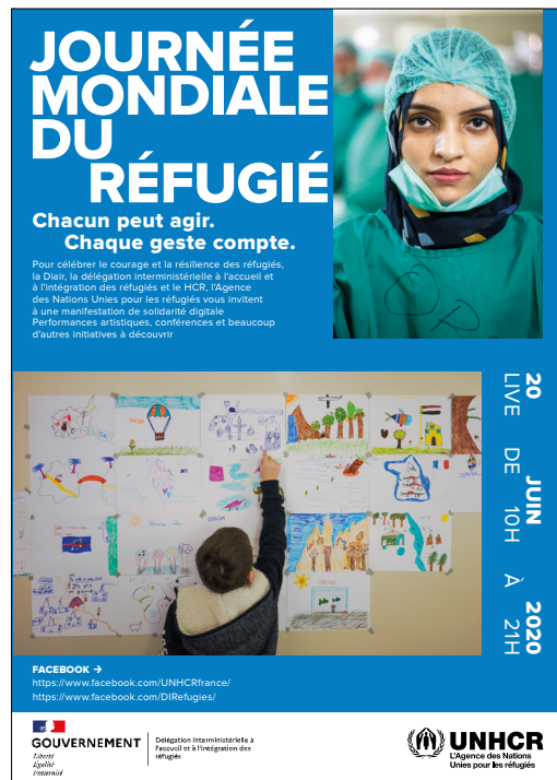
Journée mondiale du réfugié - HCR et Diair – affiche

atelier de poésie a également été proposé, illustrant le parcours d'exil et les liens permettant d'unir société d'accueil et réfugiés à travers l'art et la culture. Chacune des interventions était empreinte du vécu des bénévoles et des messages qu'ils souhaitaient porter afin d'illustrer les talents, l'expertise et l'engagement solidaire des réfugiés.