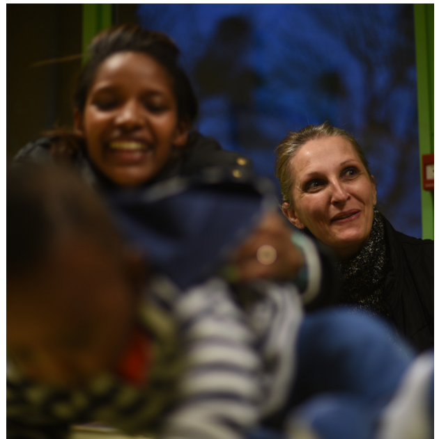
France, 8 mars 2017. Un village du Puy-de-Dôme ouvre ses portes pour les réfugiés.

Enfin, il convient de rappeler qu'en raison du nombre élevé de structures associatives en France, cette étude s'est concentrée sur celles fournissant des services aux réfugiés et demandeurs d'asile, et sur les bénévoles réfugiés et en demande d'asile engagés au sein de ces structures. Il pourrait néanmoins s'avérer pertinent, dans un second temps, d'élargir l'enquête à des structures non spécialisées dans l'appui aux personnes réfugiées et en demande d'asile, ainsi qu'à des personnes réfugiées et en demande d'asile qui ne sont pas bénévoles au sein de structures établies. Une telle ouverture permettrait d'obtenir une perspective plus large sur l'engagement solidaire des réfugiés en tant que vecteur d'intégration. Le bénévolat informel, très en vigueur parmi les communautés réfugiées et en demande d'asile, ainsi que l'engagement des réfugiés ou des demandeurs d'asile dans des structures qui ne sont pas dédiées spécifiquement aux personnes réfugiées et en demande d'asile, pourraient ainsi bénéficier d'un tel éclairage.