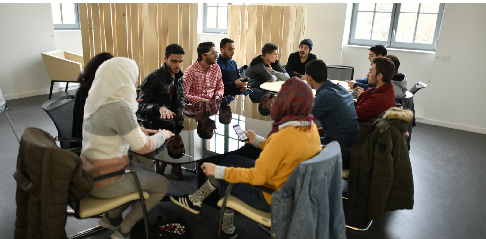
France, 13 décembre 2017. Un programme français de bourses d'études donne de l'espoir aux réfugiés syriens.

L'exercice de cartographie s'est accompagné de consultations individuelles mais aussi collectives avec les personnes réfugiées et en demande d'asile, lesquelles ont permis de mettre en pratique les recommandations évoquées précédemment. Des discussions ont été menées en petits groupes (focus group discussions, en anglais) avec des bénévoles réfugiés et demandeurs d'asile, qui ont participé à l'élaboration, la conception et la réalisation de deux projets : l'INTER'ACT Tour et le Train de la Solidarité #Aveclesréfugiés. Ces projets ont pour principal objectif de créer des opportunités de dialogue entre les réfugiés, les demandeurs d'asile et leur société d'accueil et de promouvoir le bénévolat et la participation