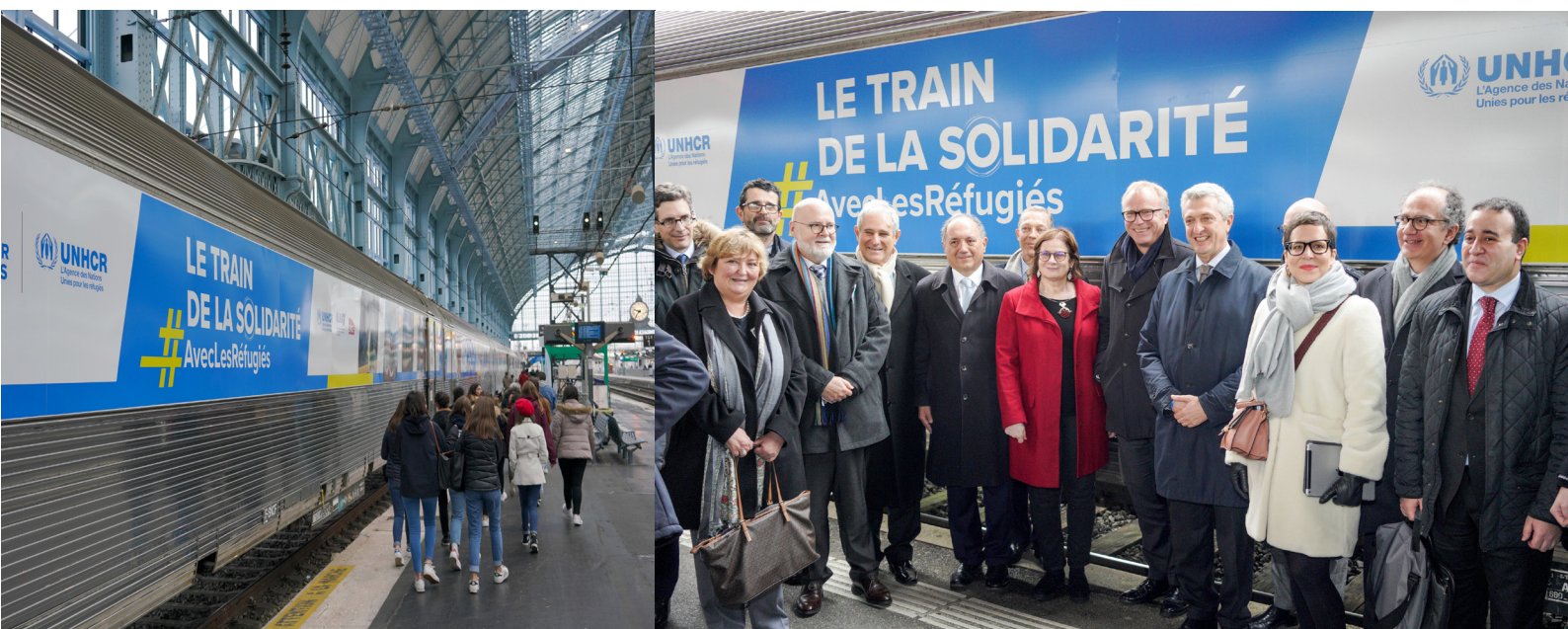
France, 16 décembre 2019. Le Train de Solidarité arrive à Bordeaux