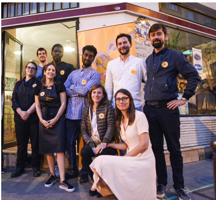
France, 17 juin 2018. Le Refugee Food Festival revient à Paris.

Cela implique de sensibiliser les réfugiés, les demandeurs d'asile et les membres de leur société d'accueil à l'interculturalité et de développer les opportunités de rencontre entre les personnes déracinées et leur société d'accueil. Il s'agit également d'accroître la coopération et la communication entre les différents acteurs et de promouvoir un environnement de protection accueillant.