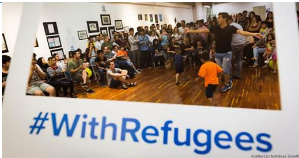
Προσφυγικές κοινότητες, η Υ.Α. και άλλες οργανώσεις τιμούν την Παγκόσμια Ημέρα Προσφύγων σε φεστιβάλ που διοργανώθηκε στις 20 Ιουνίου στην Τεχνόπολη Δήμου Αθηναίων