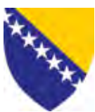
Bosna i Hercegovina