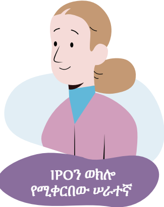
IPON ወኪሎ የሚቀርበው ሠራተኛ

የእርስዎ ማህበራዊ ባለሙያ እና ጠበቃ ከእርስዎ ጋር ወደ ይግባኝ አቤቱታ ስፍራ ይሄዳሉ። እነሱ ለእርስዎ ድጋፍ ለመስጠት ነዉ የሚገኙት ፣ ነገር ግን በራስዎ ቃላት ጥያቄዎችን እንዲመልሱ ይጠየቃሉ። አንዳንድ ጊዜ የጉባዔ አባል ከጥገኝነት ማመልከቻዎ ጋር በተያያዙ ጉዳዮች ላይ ጠበቃዎ እና የማህበራዊ ባለሙያዎ እንዲናገሩ ይጠይቃል። ጠበቃዎ ለምን የጥገኝነት ጥያቄ እንደሚፈልጉ ሕጋዊ መከራከሪያዎችን ያቀርባል።