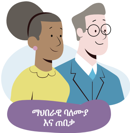
ማህበራዊ ባለሙያ እና ጠበቃ

የእርስዎ ማህበራዊ ባለሙያ እና ጠበቃ ከእርስዎ ጋር ወደ ይግባኝ አቤቱታ ስፍራ ይሄዳሉ። እነሱ ለእርስዎ ድጋፍ ለመስጠት ነዉ የሚገኙት ፣ ነገር ግን በራስዎ ቃላት ጥያቄዎችን እንዲመልሱ ይጠየቃሉ። አንዳንድ ጊዜ የጉባዔ አባል ከጥገኝነት ማመልከቻዎ ጋር በተያያዙ ጉዳዮች ላይ ጠበቃዎ እና የማህበራዊ ባለሙያዎ እንዲናገሩ ይጠይቃል። ጠበቃዎ ለምን የጥገኝነት ጥያቄ እንደሚፈልጉ ሕጋዊ መከራከሪያዎችን ያቀርባል።