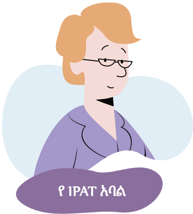
የ IPAT አባል

የጉባዔ አባል ችሎቱን ይመራል። እሱ ወይም እሷ ስለ የጥገኝነት ማመልከቻ ጥያቄዎች ይጠይቁዎታል እና እርስዎ የሚሉትን ሁሉ በጥንቃቄ ያዳምጣሉ። እሱ ወይም እሷም በችሎት ጊዜ አንዳንድ ማስታወሻዎችን ሊወስዱ ይችላሉ።