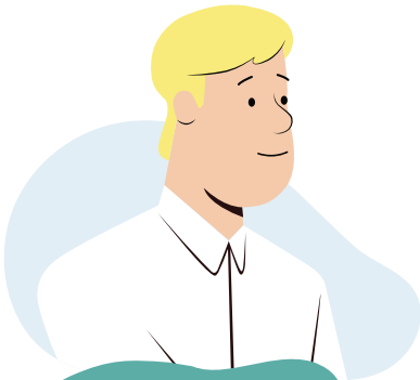
የዓለም አቀፍ ጥበቃ ቢሮ (IPO) ሠራተኛ

የዓለም አቀፍ ጥበቃ ቢሮ ሠራተኛ ለቃለ መጠይቁ ኃላፊነት አለበት። እሱ ወይም እሷ ስለ የጥገኝነት ማመልከቻዎ ጥያቄዎች ይጠይቁታል እና እርስዎ የሚሉትን ሁሉ በጥንቃቄ ያዳምጣሉ። እሱ ወይም እሷ ይህን መረጃ በኮምፒተር ወይም በፅሁፍ ይመዘግባሉ። ይህ የቃለ መጠይቅ መዝገብ በመባል ይታወቃል።